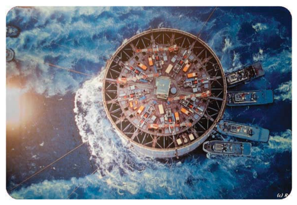
شکل ۲-19 عملیات حمل و استقرار کیسون توسط ۱۲ کشتی یدک کش (نما از بالا)

ما کابل ها را با عبور از قرقره های قرار گرفته در بالای کیسون شناور کشیده و به مهارهایی در کف دریا که هریک تقریباً ۱۰۰۰ تن وزن داشتند متصل نمودیم (شکل ۲–۲۰).